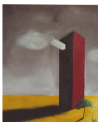
Óleo sobre tela "Solidão" 2008 60x50cms