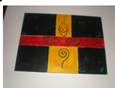
Acrílico sobre tela 61x45cms