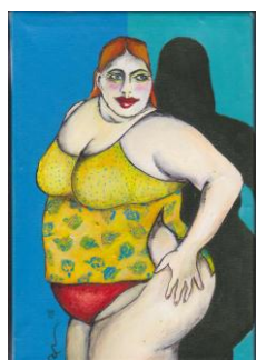
Acrílico s/tela "Dieta" 2008 30x20cms