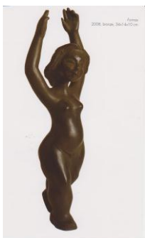
Bronze "Formas" em peanha mármore 2008 34x14x10cms