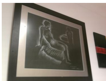
(3) Pastel s/papel 2002 60x40cm