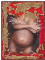
Acrílico sobre tela "Mater" 2007 24x18cms