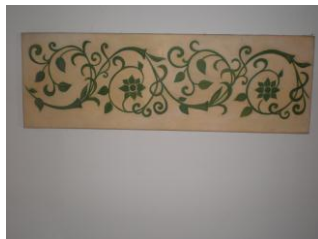
(2) 2 x acrílico sobre tela 78x26cms