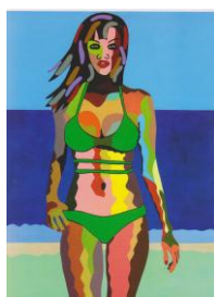
(2) Acrílico sobre tela "Junto al mar" 81x65cms