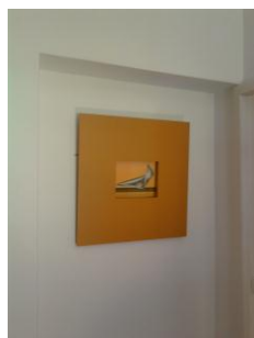
Acrílico s/tela 2008 moldura em madeira