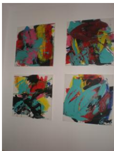
(1) 4 x Acrílicos sobre tela 2007 55x55cms