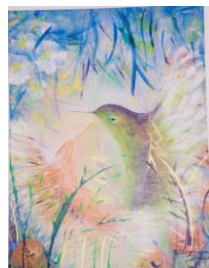
Acrílico s/tela 2010