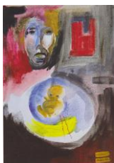
Acrílico sobre tela "Solidão 2008 25x35cms