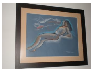
(2) Pastel s/papel 2002 40x60cms