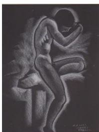
(1) Pastel s/papel negro "Nu" 2002 65x50cm