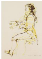
Guache sobre papel "Mozart" 2006 70x40cm