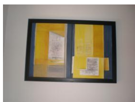
Óleo sobre tela "Coisas por dizer" 2000 40x60cms