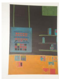
Acrílico sobre tela "Apetece-me aquele café" 0,70x1m